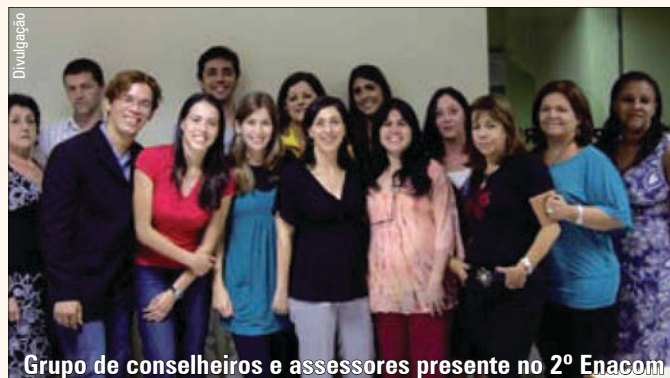
Grupo de conselheiros e assessores presente no 2º Enacom