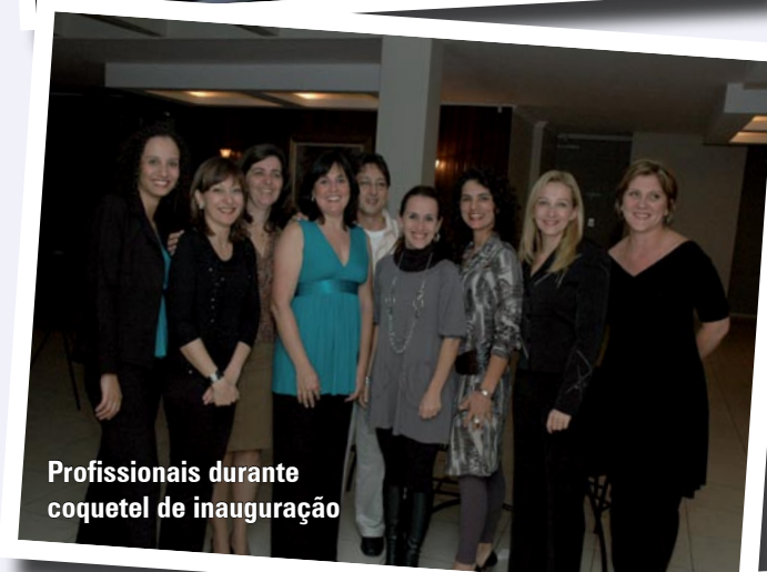
Profissionais durante coquetel de inauguração