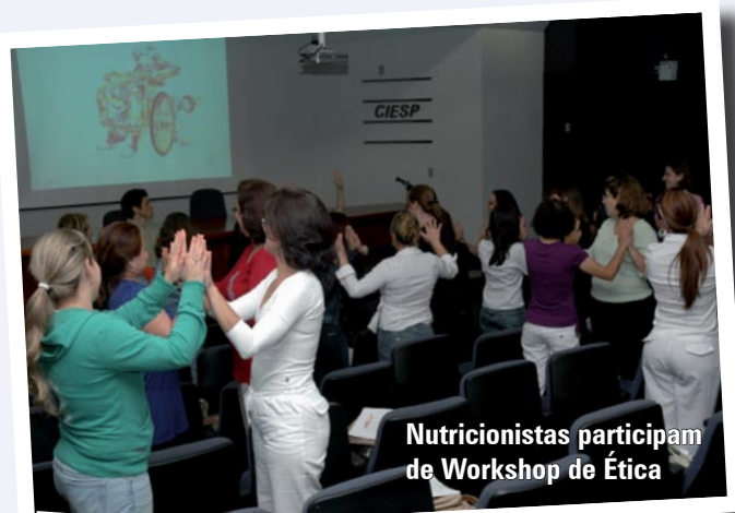
Nutricionistas participam de Workshop de Ética