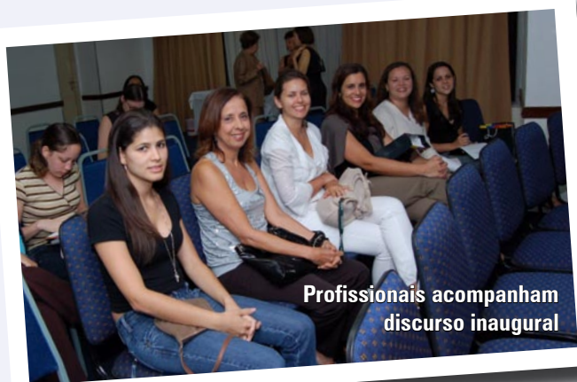
Profissionais acompanham discurso inaugural