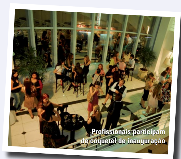
Renato Miliani/Foto M