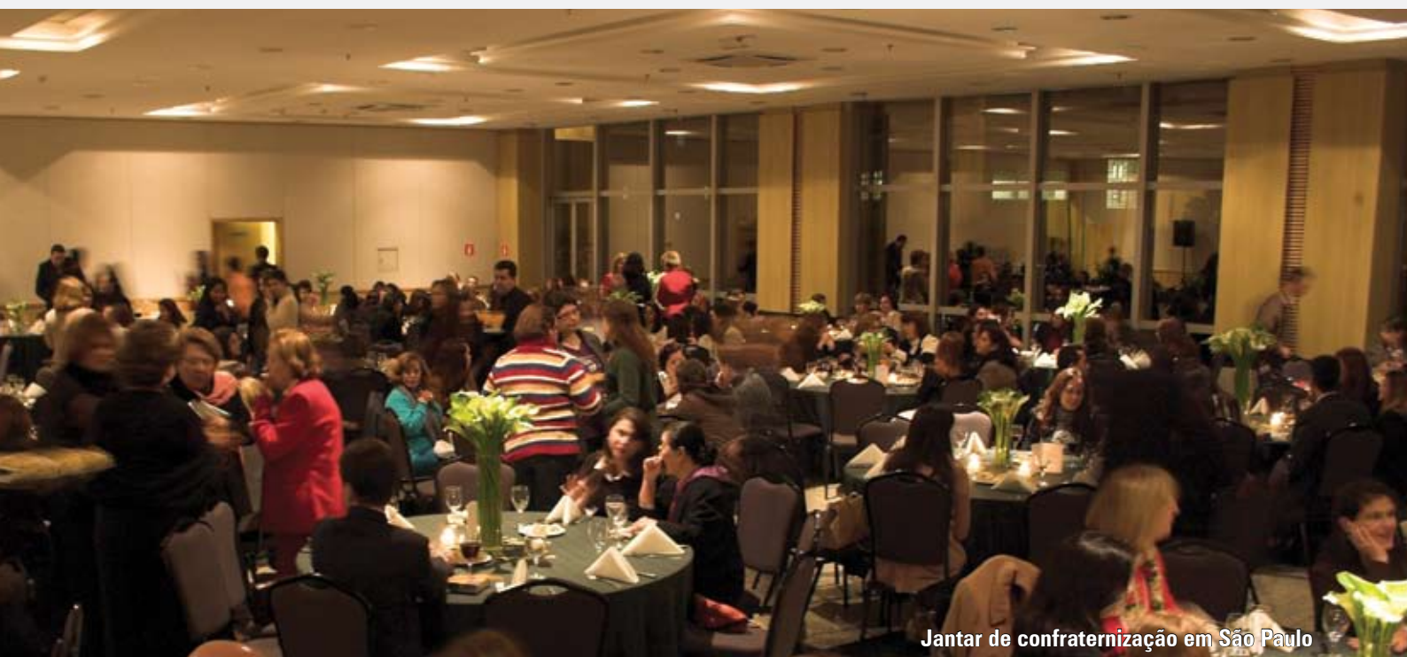
Jantar de confraternização em São Paulo