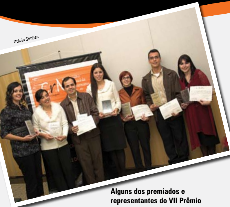
Alguns dos premiados e representantes do VII Prêmio Maria Lúcia Ferrari Cavalcanti

Na busca pela agilidade da informação, implantou-se o CRN-3 24 Horas, que oferece atendimento on-line por meio do site.”