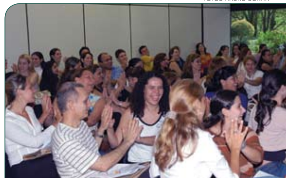
Participantes interagem em dinâmica