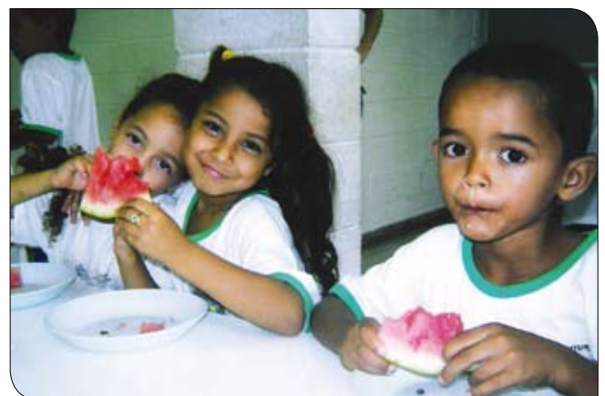
Hábitos alimentares saudáveis são ensinados em sala de aula e praticados na hora da merenda.