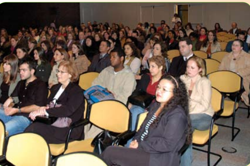
Público assiste premiações do coquetel de confraternização